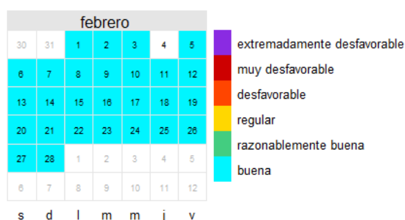
NO 2 Febrero 2021